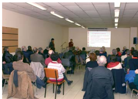
Réunion sur le logement du 30 janvier 2007

4 000 euros en moyenne dans le neuf pour un appartement, 5 000 euros pour une maison, plus de 14 euros par mètres carrés à la location pour un appartement.