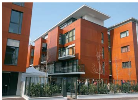
Résidence Émile Decœur à Fontenay: des logements sociaux de qualité aux normes HQE

À Clamart, Bagneux, Fontenay et Malakoff, communes constituant la communauté d'agglomération "Sud-de-Seine" les maires ont décidé de prendre le taureau par les cornes : A Fontenay, 100 % des logements construits sont des logements sociaux et une grosse opération de rénovation de l'habitat est en cours.