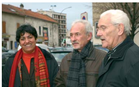
Vos élus allant voir les commerçants du "Cœur de Ville"